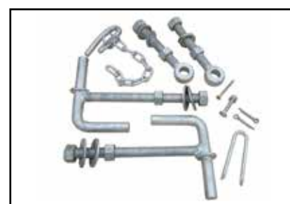
Vnr. 59031: Komplette beslagpakke.

Stålgrindene er dessuten forberedt til montering av en svært kraftig låsebolt.