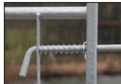
Vnr. 59081: Kraftig låsebolt. Leverages med anslag til stolpe.

Med forbehold om produktendringer og trykfeil.