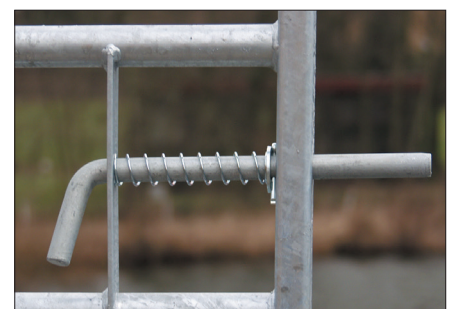
Art. nr. 59081: Grendel voor metalen landhek.