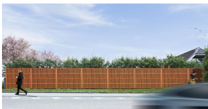
Holzverkleidung Braun RAL 8003