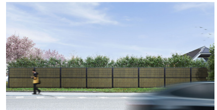
Schwarz RAL 9005