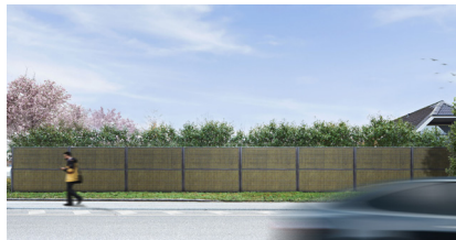
Anthrazit RAL 7016